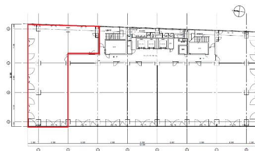
9階 GH区画 72.59坪