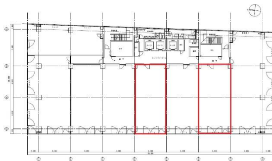
5階 B,D 28.75坪 2区画