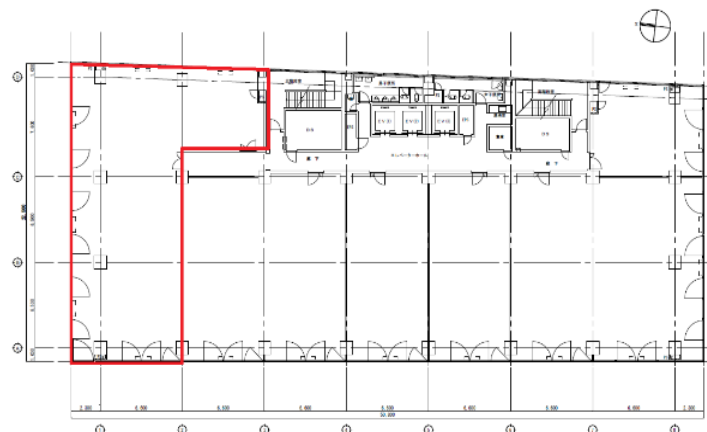
9階 GH区画 72.59坪